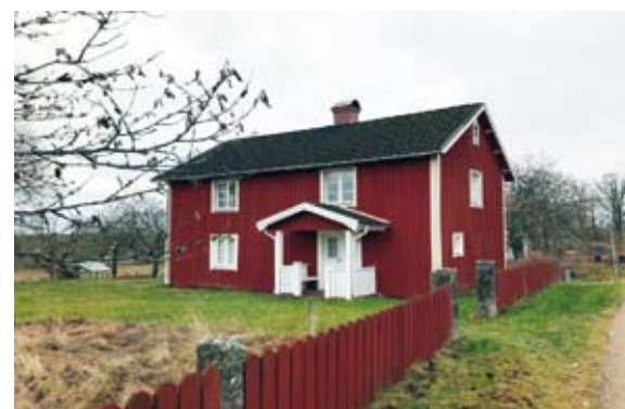
Olsagård i Furuby, Sverige