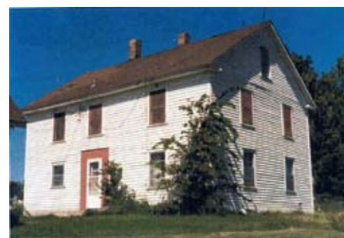
Olsagård i Lindstrom, Amerika