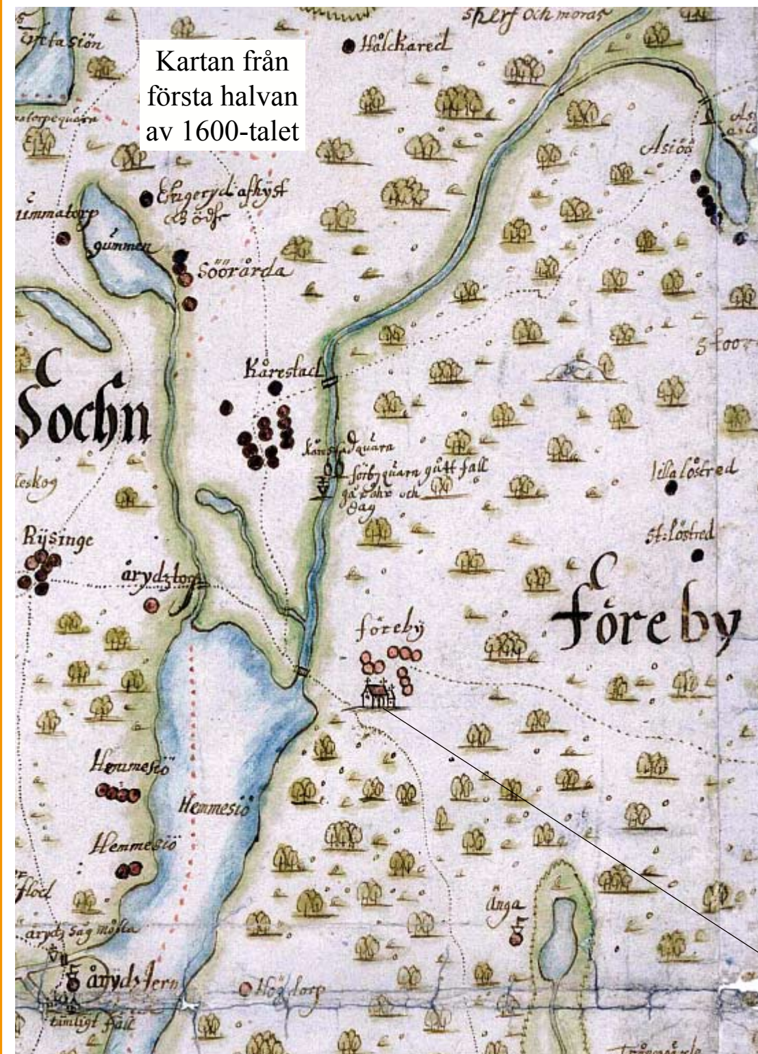
Kartan från första halvan av 1600-talet

För att komma från Furuby till Kårestad, Risinge och Åryd användes Häradsvägen ner till broarna vid Årydssjön. Vitarörsvägen byggdes delvis om på 1860-talet. Fortsättningen på Byvägen ledde, då som nu, vidare till Hovmantorp och Lessebo.