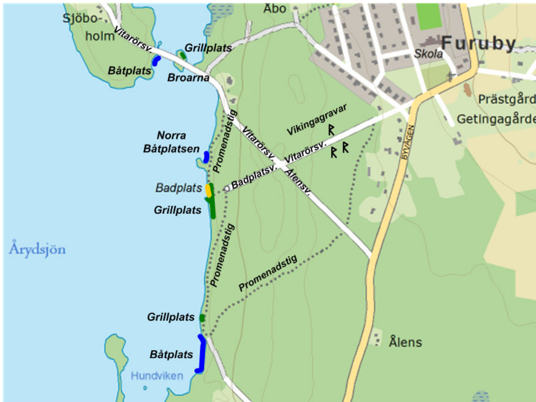
Figur 3, Etablerade upplevelsevärden

Övriga närliggande upplevelsevärden: Broarna Båt- respektive Grillplats och Vikingagravarna.